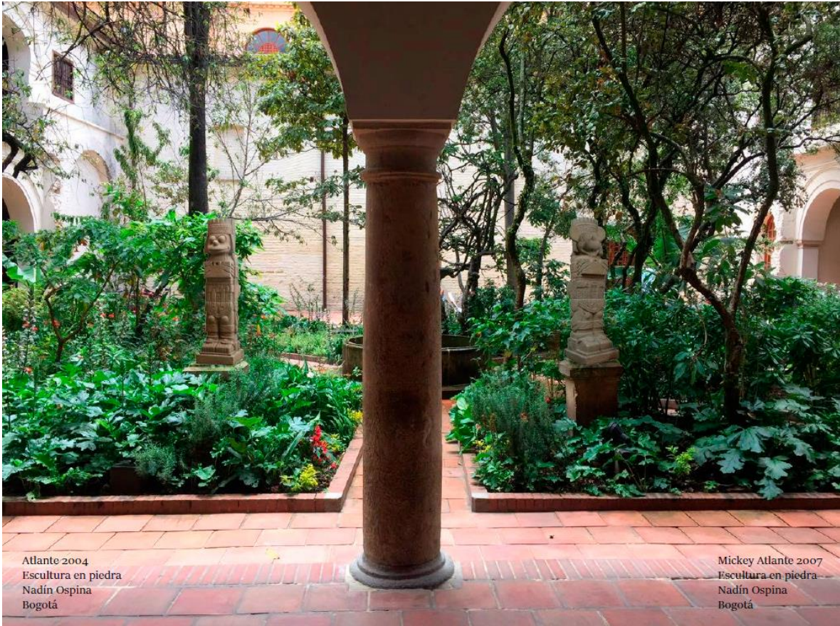
Atlante 2004 Escultura en piedra Nadín Ospina Bogotá