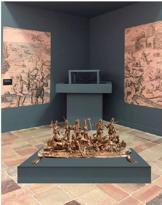
La caza de los putos 2013 Escultura en bronce Nadín Ospina Bogotá