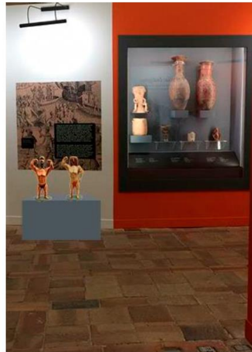
Fisiculturistas 2015 Escultura en bronce Nadín Ospina Bogotá