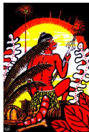
Hombre cola de lagarto [2018] Ilustración Richard Pantoja Putumayo