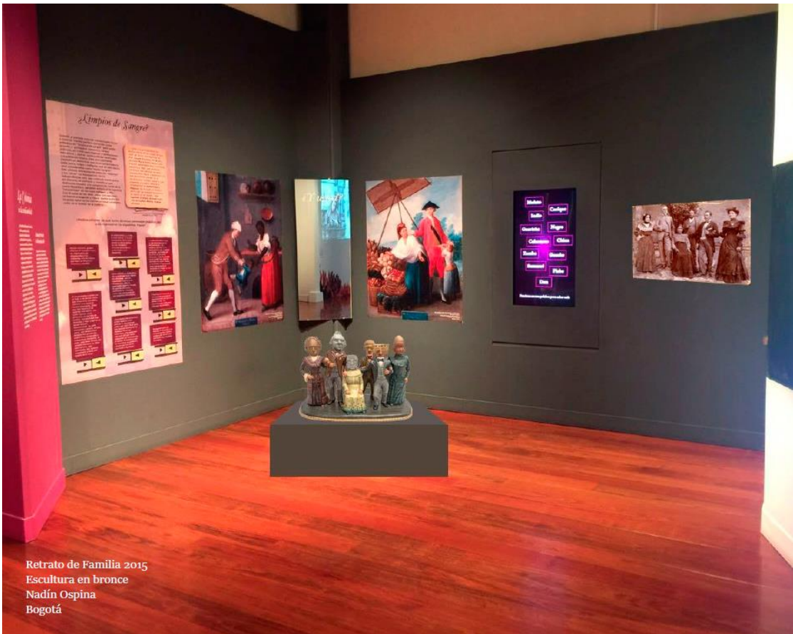
Retrato de Familia 2015 Escultura en bronce Nadín Ospina Bogotá